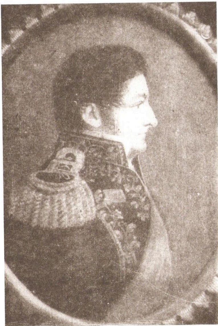
Archivo General de la Nación - Foto Nº 324 de mi archivo. "Don Juan Manuel de Rosas" de Carlos Morel (miniatura sobre marfil)

Las circunstancias históricas de principios del siglo XIX lo habían persuadido de que la guerra contra todos los indios era un camino por el que difícilmente pudiera lograrse la expansión de las fronteras. Por el contrario la experiencia en el trato que había tenido con algunos de ellos en sus estancias, lo habían convencido de que al menos parte de esos indígenas podrían colaborar en aquella empresa, convertidos en peones y soldados adaptados al orden rural.