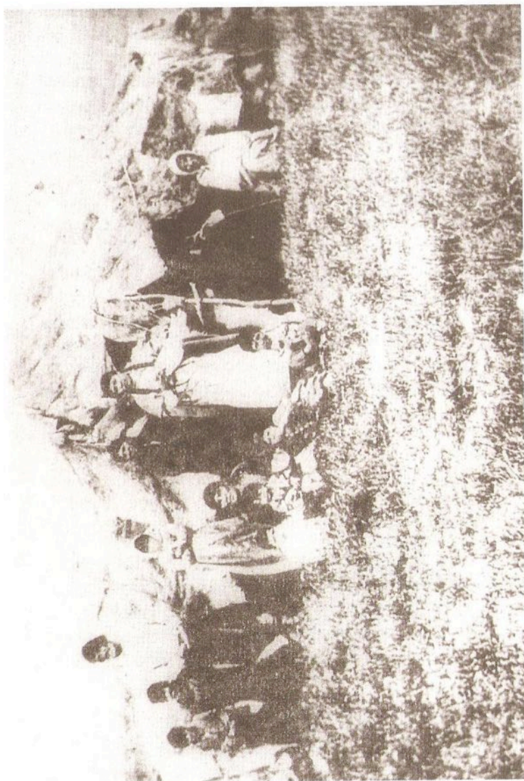
Archivo General de la Nación - Foto N° 333 de mi archivo. Toldo indígena con sus moradores

dueño y poseedor de una parte considerable de terreno en las costas del Salado, en el rincón llamado del Toro, y que de allí lo habían arrojado los cristianos, con graves perjuicios de sus intereses, y expuesto a perecer de indigencia en países extraños, pidiendo por último que se le devolviese. Otro dijo al mismo tiempo, que cerca de la guardia de Kakelhuincul había tenido su establecimiento, y que había tenido que emigrar a una larga distancia para librarse de las tropelías que sufría de los cristianos. Una multitud de ellos redobló estas mismas quejas, porque les parecía que había llegado el caso de pagarles cuanto habían perdido y que en los tratados debía acordarse para su indemnización.” 11