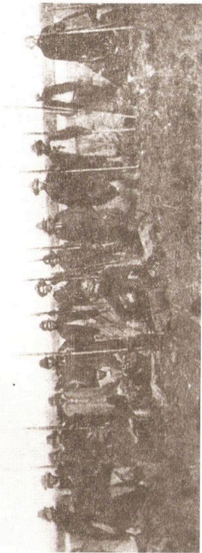
Archivo General de la Nación - Foto Nº 329 de mi archivo. Indios amigos junto a efectivos del ejército.

La intención era que los racionamientos comenzasen a hacerse en períodos regulares. Esto sin duda constituía un desafío ya que no era sencillo contar con los recursos en el momento necesario, y mucho menos aún acostumbrar a los indios a administrar las raciones para que les durasen el tiempo estipulado. La documentación muestra las dificultades que tuvieron Rosas y sus comandantes para lograr esto último.